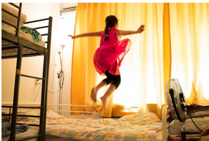
Kinderpostzegels helpt kinderen die in de opvang wonen