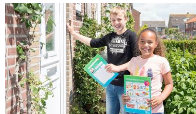
Verkopen voor het goede doel