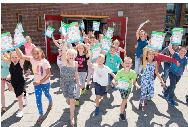
Schoolkinderen doen mee aan de Kinderpostzegelactie

Meer dan 150 000 schoolkinderen gaan postzegels _____