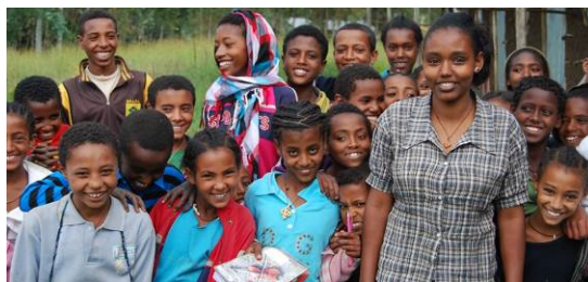
Kinderpostzegels steunt kinderen in Afrika