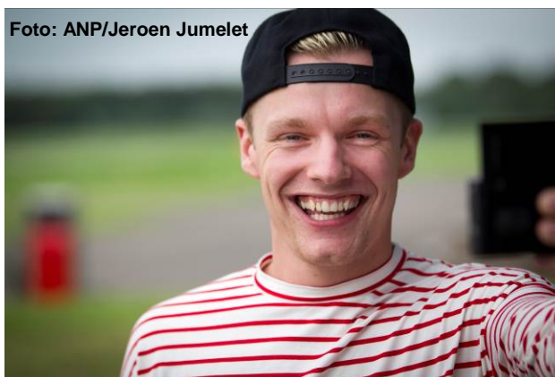
Enzo Knol maakt dagelijks vlogs die hij op YouTube zet