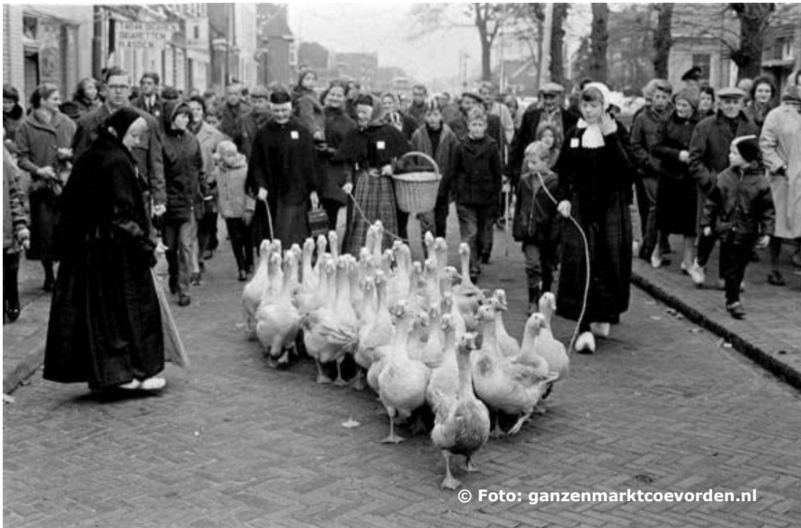
Ganzen werden door ganzenhoedsters gedreven tijdens de Ganzenmarkt in 1966.