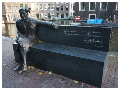
Beeld (van Peter de Leeuwe) van majoor Bosshardt op de Oudezijds Voorburgwal