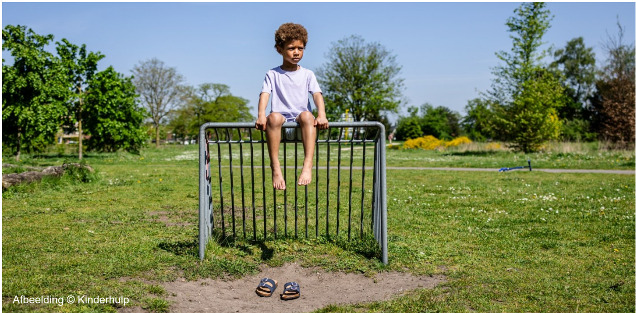
Afbeelding © Kinderhulp